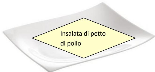
pollo Paradello Bio bollito disossato e servito in insalata con porro condito con olio bio